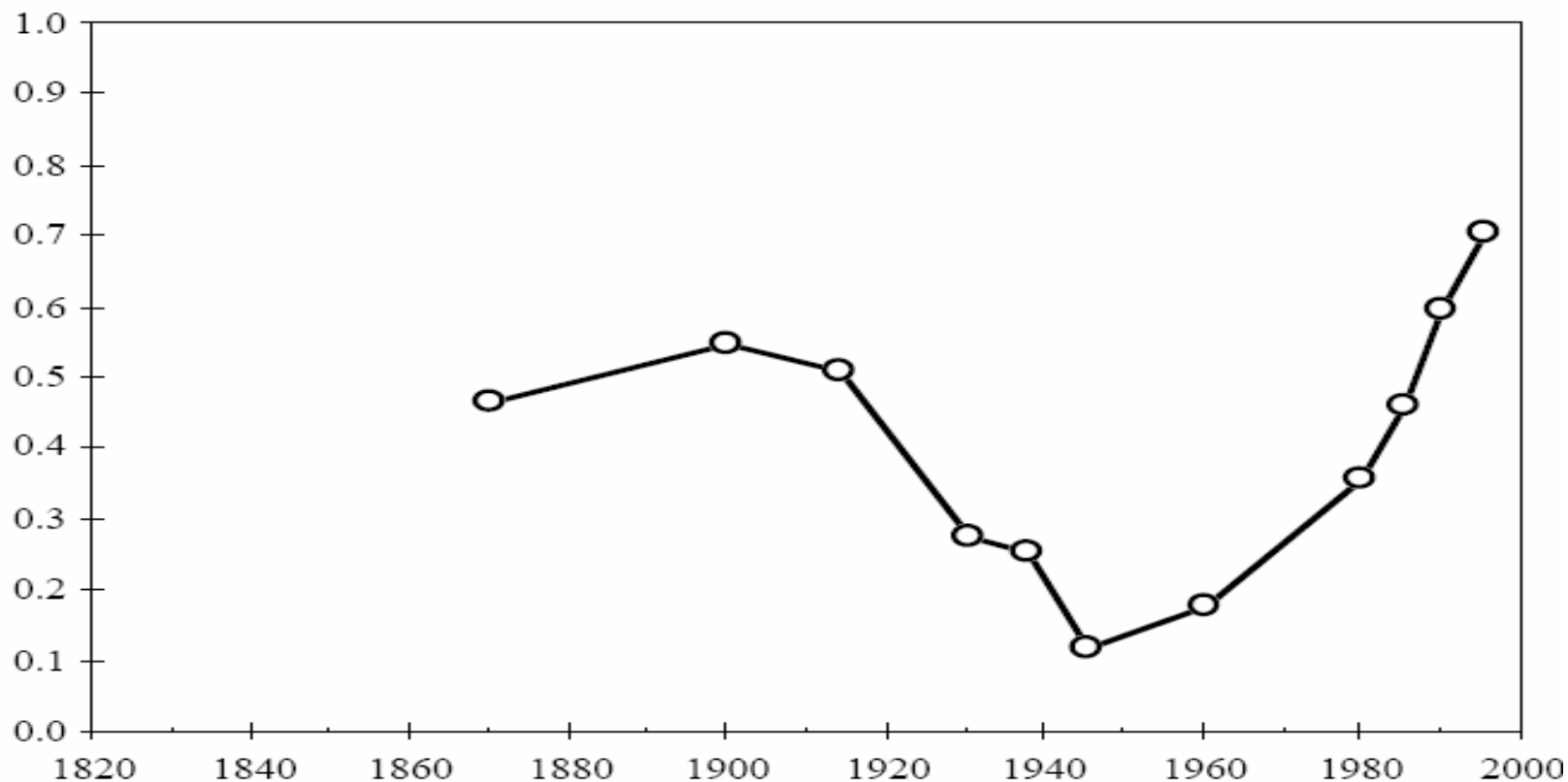
Figure 2 International Investment as a Fraction of GDP Since 1870